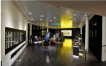
Einblick in das SGL GROUP Forum in Meitingen

Mit dem neuen SGL GROUP Forum in Meitingen hat die SGL Group ein 1.700 m 2 großes Kommunikationszentrum eingerichtet, das eigene Technologien und Produkte für Kunden, Mitarbeiter und Interessenten erlebbar vermittelt. In einem Ausstellungscenter werden Produkte rund um den Werkstoff „Carbon“ anschaulich präsentiert. Daneben gibt es ein Konferenzcenter, das für Schulungs- und Trainingszwecke genutzt werden kann. Das SGL GROUP Forum soll auch dazu dienen, die Kommunikation zwischen Wissenschaft und Wirtschaft auf diesem Gebiet und die „Carbon Composites Region Süd“ weiter voran zu treiben.