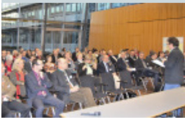
Teilnehmer der Chankonferenz 2009

Eine alternde Gesellschaft hat Auswirkungen auf das tägliche Leben, die wirtschaftliche Entwicklung und die Gestaltung der Region. Um diese Herausforderungen von morgen zu meistern, haben sich die Regio Augsburg Wirtschaft GmbH, die Stadt Augsburg, die AIP Augsburg und die Wirtschaftsuniönen Augsburg dem Thema „Wirtschaftliche Perspektiven durch den demografischen Wandel“ auf der Chankonferenz 2009 angenommen. 120 Vertreter aus Unternehmen, Verbänden, Kommunen und Politik nahmen im November 2009 die Veranstaltung zum Anlass, sich in Vorträgen zu informieren und in insgesamt sieben Workshops zu diskutieren. Nach einer Einführung zum Thema demografischer Wandel und einen Überblick zur Wohnungsmarktentwicklung und der Familienpolitik konnten die Teilnehmer dann in sieben Workshops die Diskussion vertiefen. Zur Auswahl standen u.a. Gesundheitsmanagement, Lebenslanges Lernen und Wohnungsmarktanforderung der Zukunft. Interessierte finden die Ergebnisse unter www.region-A3.com/chankonferenz_2009.html .