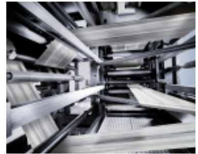
Falzaufbau der LITOMAN: Die Papierleitwalzen sind CFK-ummantelt.

Carbon wird weiterhin gezielt eingesetzt, immer dann, wenn die materialspezifischen Kennwerte Vorteile bei den Bauteilen ergeben. Entwicklungstendenzen wie Energieverbrauch sowie Leistungssteigerung fördern diesen Trend.