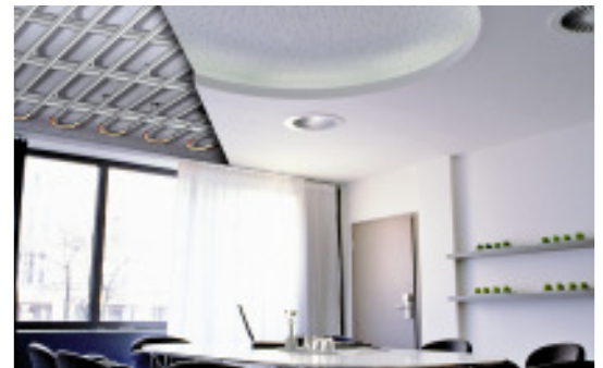
ECOPHIT® - Aus der Natur, für die Natur

schutzeigenschaften sowie einen fast vollständigen Schutz gegen elektromagnetische Strahlungen auszeichnet. Diese unter dem Markennamen Klimafit™ erhältliche wegweisende Innovation aus der Umweltkompetenzregion A 3 wurde als „KUMAS-Leitprojekt 2009“ ausgezeichnet.