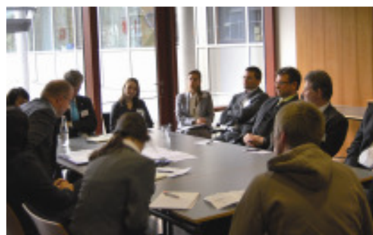
In kleinen Arbeitsgruppen diskutierten die Teilnehmer der Chankonferenz die Themenfelder und formulierten Lösungsansätze.

GmbH zu vernetzen. Die Teilnehmer des Workshops waren sich einig, dass sowohl für die Unternehmen in der Region wie auch für professionelle Personalakquisiteure bislang kein geeignetes Marketingmaterial vorliegt. Auch hier wurde die Regio Augsburg Wirtschaft GmbH als geeigneter Träger für die Entwicklung solcher Materialien be-