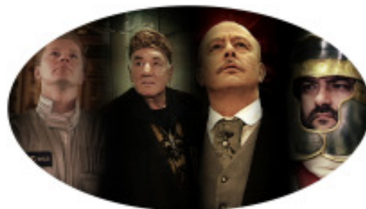
Schauspieler aus dem Standortfilm

sowie potentiellen Investoren. Er existiert als Vollversion in den Sprachen Deutsch und Englisch. Nach der Premiere am 25.02. kann der Film kostenfrei angefordert unter willkommen@region-A3.com.