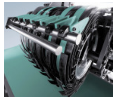
Das abschwenkbare Schaukelrad im Falzwerk besitzt CFK-Schaukeln.