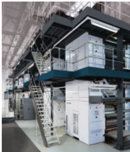
Gesamtansicht der Zeitungsdruckmaschine COLORMAN, XXL bei der Augsburger Allgemeinen.