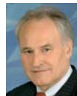
Erwin Huber Bayerischer Staatsminister für Wirtschaft, Infrastruktur, Verkehr und Technologie