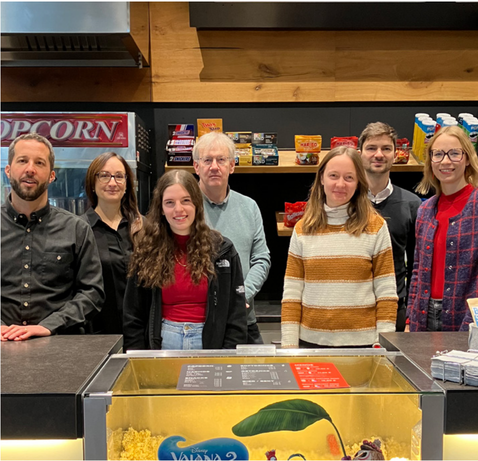
WIR FREUEN UNS ÜBER IHRE TEILNAHME UND IHREN BEITRAG ZUM KLIMASCHUTZ IN DER REGION!