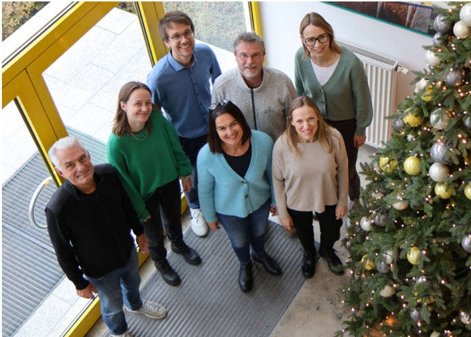
Die Part Business Solutions GmbH hat die Kommissionsprüfung erfolgreich bestanden.

Zu nennen ist darüber hinaus eine qualitative Maßnahme, welche in die Berechnungen nicht mit aufgenommen werden konnte. So bietet der Zoo Augsburg vermehrt Angebote im Bereich der Umweltbildung für die Besucher an.