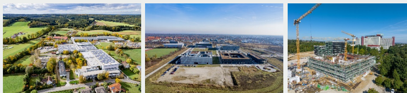
Bild 1: Überdurchschnittliche Bauaktivität in den Landkreisen Augsburg und Aichach-Friedberg

Die gesamte Pressemitteilung finden Sie hier: https://www.region-a3.com/news/a3-auf-der-expo-real-2026/