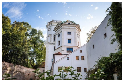
Wassertürme am Roten Tor

UNESCO Welterbestätten – Das Augsburger Wassermanagement-System Führungen in kleinen Gruppen zu ausgewählten Welterbe-Objekten Mittwoch, 22. Juni 2022, ab ca. 17:00 Uhr